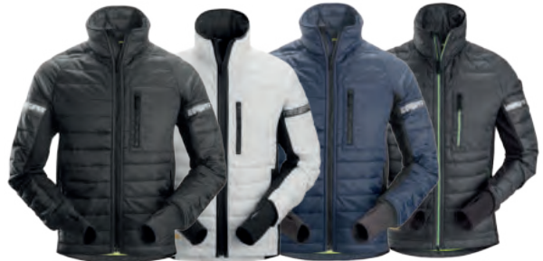
0404 Black 0904 White 9504 Navy 5804 Steelgrey