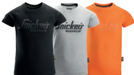
0400 Black 2800 Grey Melange 4100 Warm Orange