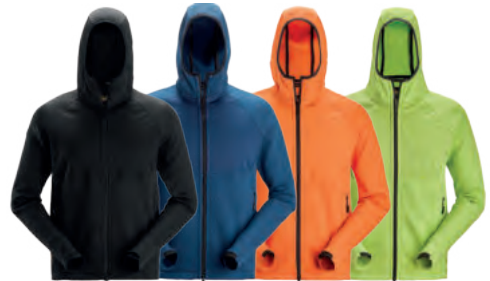
0404 - Black

Material: 94 % Polyester, 6 % Elasthan, 289 g/m 2