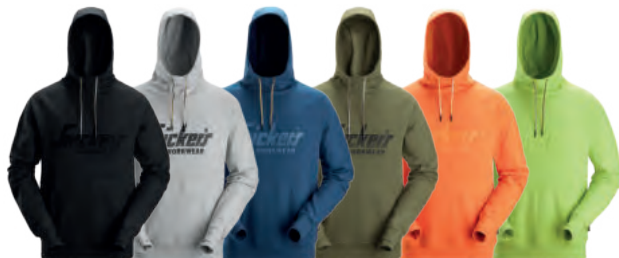
0400 Black 2600 Grey Melange 5300 Deep Blue 3100 Khaki Green 4100 Warm Orange 2500 Lime