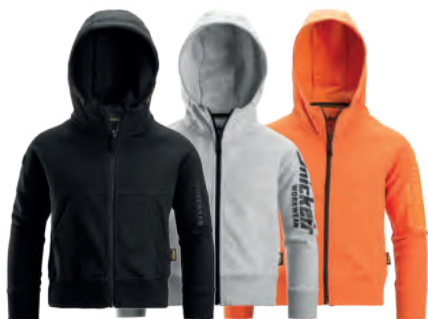
0400 Black 2800 Grey Melange 4100 Warm Orange